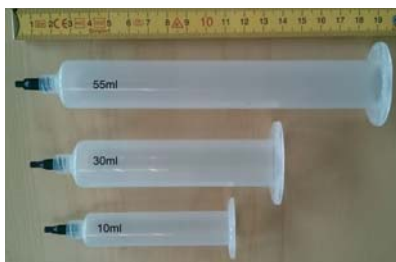
Spritzen á 55 ml, 30 ml, 10 ml mit 16 Wochen Lagerbeständigkeit