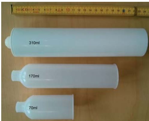
Kartuschen á 310 ml, 170 ml, 70 ml mit 6 Monaten Lagerbeständigkeit

Verpackungseinheiten | Lagerbeständigkeit