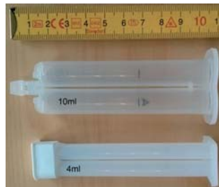
Zwei-Kammer-Spritzen 10 ml, 4 ml (nur G-GLUE-A2 S09) mit 6 Monaten Lagerbeständigkeit

Alle Gebinde werden auftragsbezogen produziert und in Vakuumbeuteln verschweißt geliefert. Eine Lieferung in kundenspezifischen Gebinden ist auf Anfrage möglich.